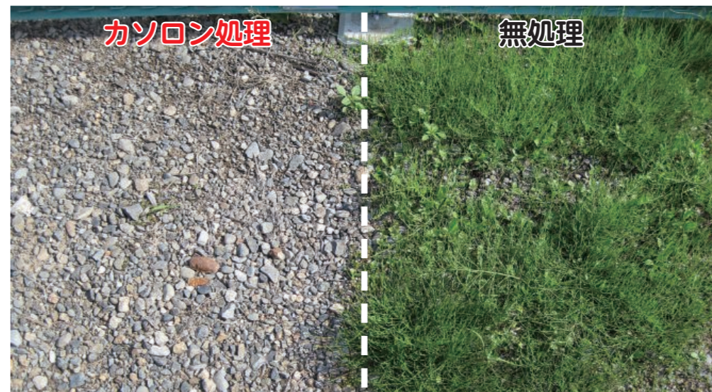
使用例) 処理日:11月5日 [翌年7月15日撮影]

アグロ カネショウ(株) 北海道支店 札幌市厚別区厚別中央2条5-3-31 TEL. 011(890)1755