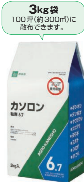
※5kg包装と1kg包装もあります